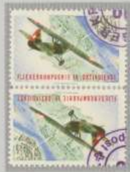
Kehrdruk senkrecht gestpi. Normalpapier: grün/olivrot