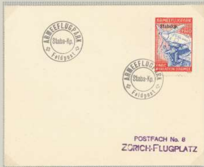
Feldpostbrief mit Marke schwarzer Aufdruck „Stabskp“, Feldpoststpl. „Armeeflugpark Stabs-Kp“

Entwerfer: A. Hug, Dübendorf Druck: Ringier, Zofingen