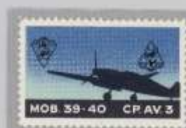
Probe Wappen links kopfstehend + rechts oben, unter Hundekopf Zusatz, „CP.3AV.“