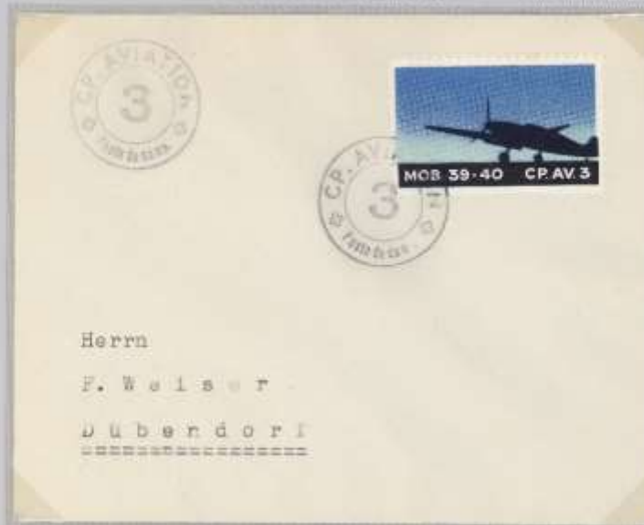
CP.Av.3, Schwarzdruck nach rechts verschoben ca 0.5 mm, Einheitsstempel „CP. Aviation + Poste de camp. +, 3“