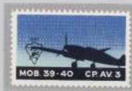
Schwarzes Wappen mit 1941 links kopfstehend