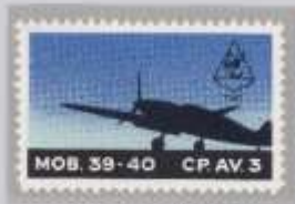
Schwarzes Wappen mit 1941 rechts oben.