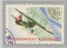
Normalpapier, gezähnt; Farbe: grün/olivrot, gestempelt.

Bild: Flugzeug über Landschaft Entw.: Fl-Sdt W. Schaer, Zürich Druck: Gebr. Fretz AG, Zürich