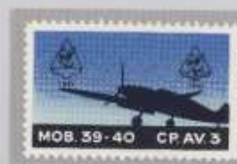
Schwarzes Wappen 1941 links oben und oben rechts Probe Wap-pen 1942 schwarz, im unteren Teil des Wappens. Zusatz „CP. 3 AV.“