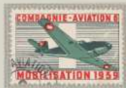
Gez., Farben dunkle Tönung