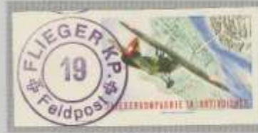
Normalpapier, geschritten; Farbe: grün/olivrot, gestempelt.