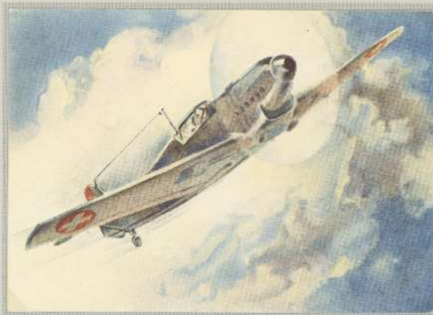
Jagdmaschine / Avion de chasse von I. E. Hugentobler. Karte an Privatadresse, SD-Marke BR. 9 Mont., FP-Stempel Stab Verpflegungs Abteilung 9