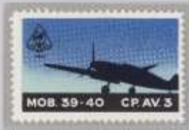
Probe Wappen links oben, mit 1942 unter Hundekopf Zusatz, „CP.3AV.“