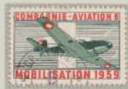
Gez., Farben grün und rot helle Tönung