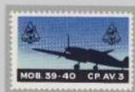
Probe Wappen links + rechts oben, unter Hundekopf Zusatz, „CP.3AV.“