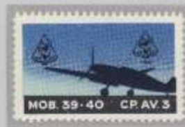
Probe Wappen links + rechts oben, unter Hundekopf Zusatz, „CP.3AV.“ Rechts oben mit Jahreszahl 1942.