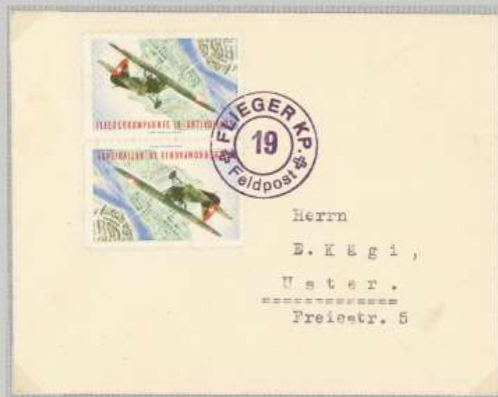
Brief an Privatadresse mit Kehrdruk wasgerecht, Fahrgestellt/Fahrgestellt; Normalpapier; mit Feldpoststempel der Flieger Kp 19