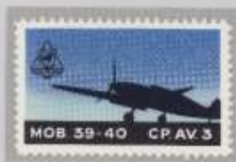
Probe Wappen links oben, unter Hundekopf Zusatz, „CP.3AV.“