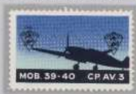
Probe Wappen kopfstehend links + rechts oben, unter Hundekopf Zusatz, „CP.3AV.“ Links oben mit Jahreszahl 1942.