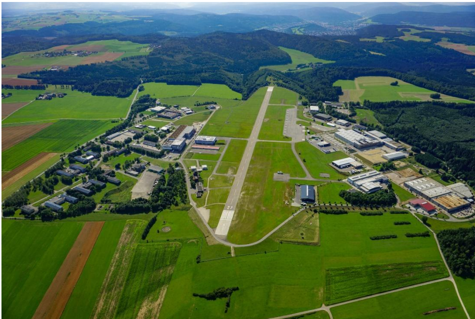
Piloteninformationen Flugplatz Neuhausen ob Eck